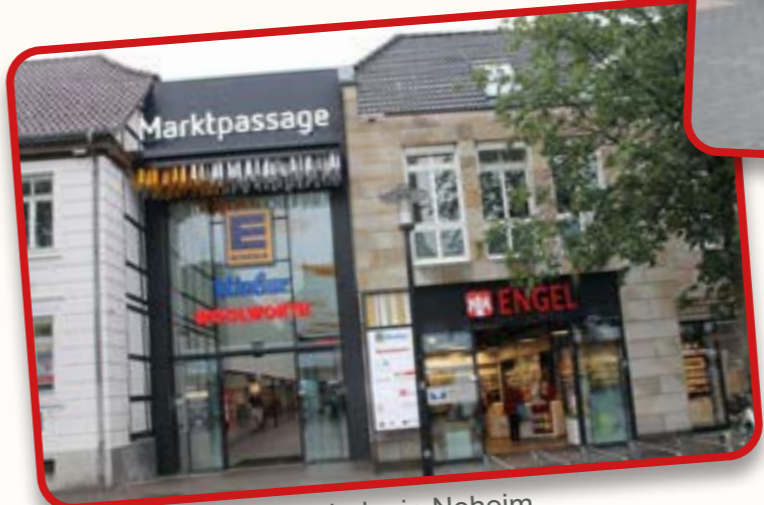
Engel Apotheke in Neheim