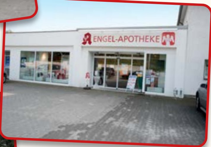
Engel Apotheke in Möhnetal