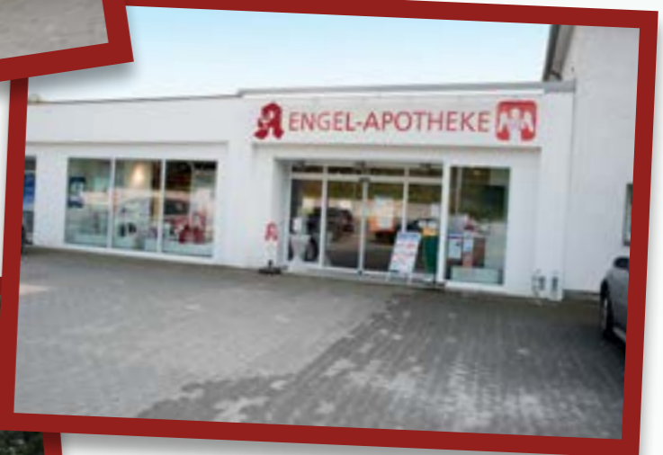
Engel Apotheke in Möhnetal