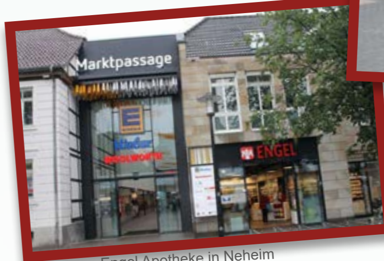
Engel Apotheke in Neheim

Lieferservice: Wir liefern Ihnen Ihre Arzneimittel. Rufen Sie uns an!